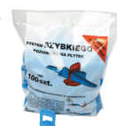
TEO 100 szt./pcs