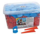
TEO K 100 kpl./sets